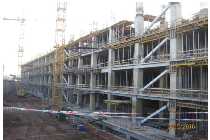
Vista fachada oriente.