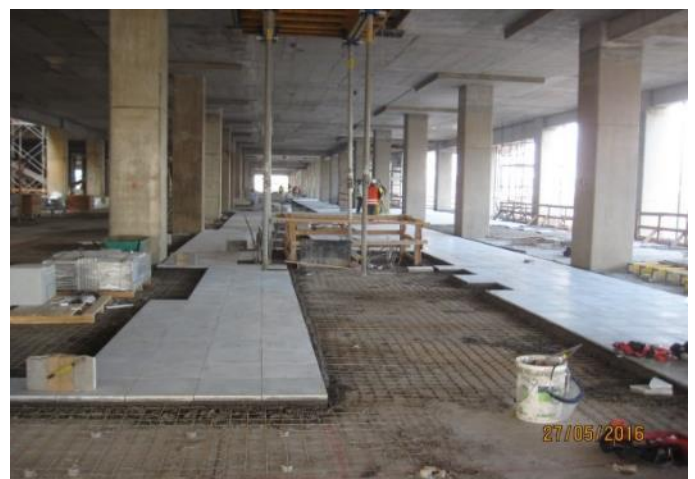
Vista parcial pavimentos piso 1.