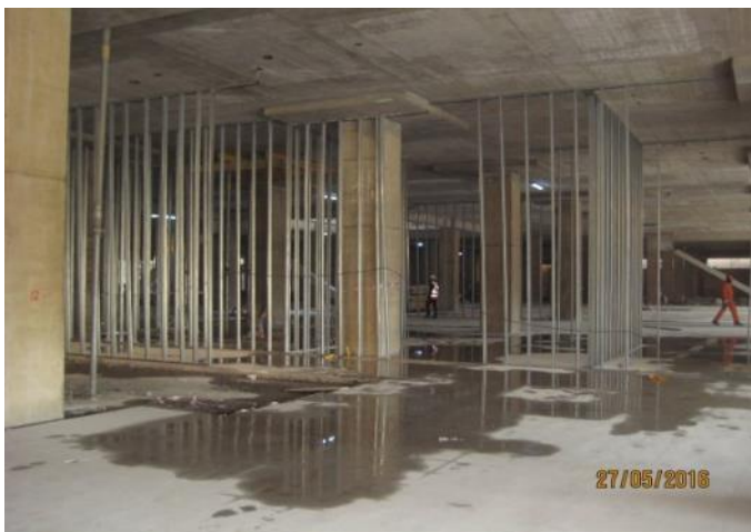
Vista estructura de tabiques subterráneo -1.