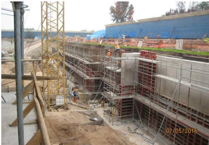
Avance muro perimetral fachada oriente.