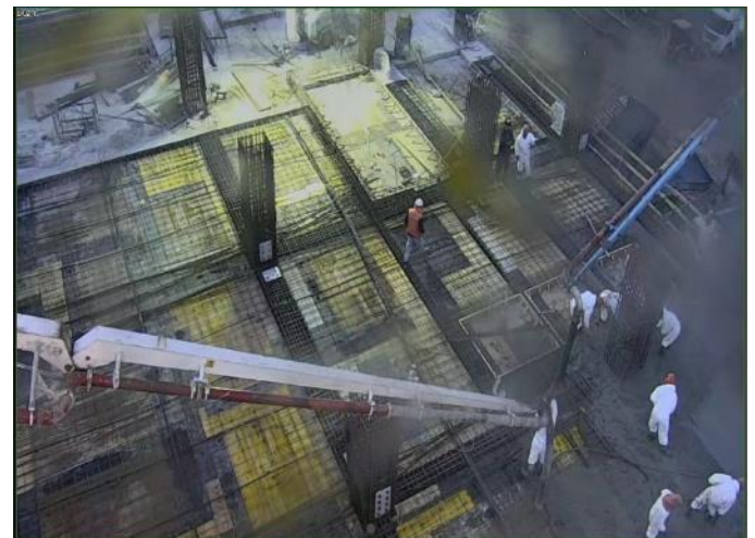
Vista parcial obra gruesa losa cuarto piso.

Respecto al avance constructivo de la obra, las imágenes muestran faenas representativas del desarrollo del mes.